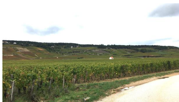
Vignobles et montagne de Beaune