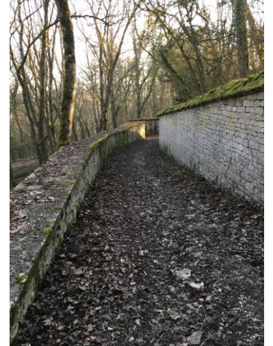
Sentier château La Rochepot

La montagne et les vignobles de Beaune, Saint-Romain, son vieux village et ses carrières de Sampeaux, les falaises de Saint-Romain et d'Orches, la Fontaine du Chêne à Orches, le village de Vauchignon (proche de Nolay) et ses falaises du « Bout du Monde », le Château de La Rochepot, le sentier des Cabotes entre Melin et Auxey-Duresses, les vignobles de Monthelie, Meursault et Pommard.