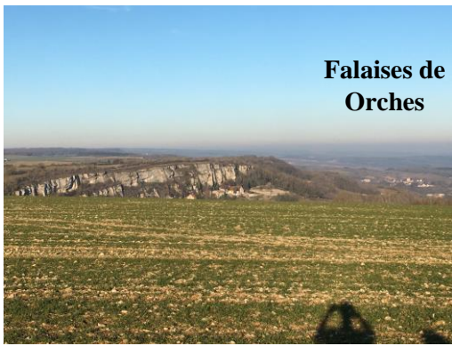
Falaises de Orches