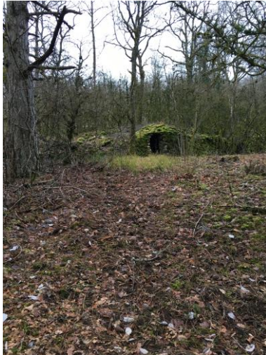
Cabote sur le sentier des cabotes d'Auxey Duresses