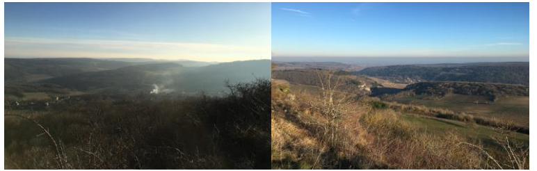
Depuis la table d'orientation de Orches Villages d'Evelle, Baubigny et La Rochepot